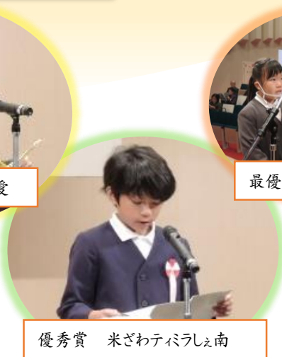
優秀賞 米ざわティミラしえ南