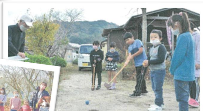
城之町上自治会(東市来)

両自治会の交流と親睦を深め、1年間の無病息災を祈る。子どもたちに疫病退散や合格祈願などの絵馬を書いてもらい奉納、地域の伝統行事への理解と伝承を行った。