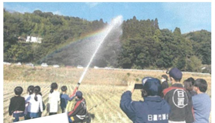
猪鹿倉・朝日ヶ丘自治会(伊集院)

一人暮らしの高齢者が日頃行うことが難しい作業を行い、新年を心地よく迎えていただく。自治会員には相互に支え合っているという意識をもち、共同募金が地域福祉事業に活用されていることを知るきっかけになった。