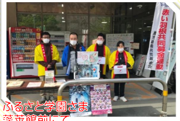
ふるさと学園さま 蓬萊館前にて