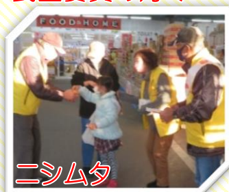
ニシムタ 伊集院店前にて