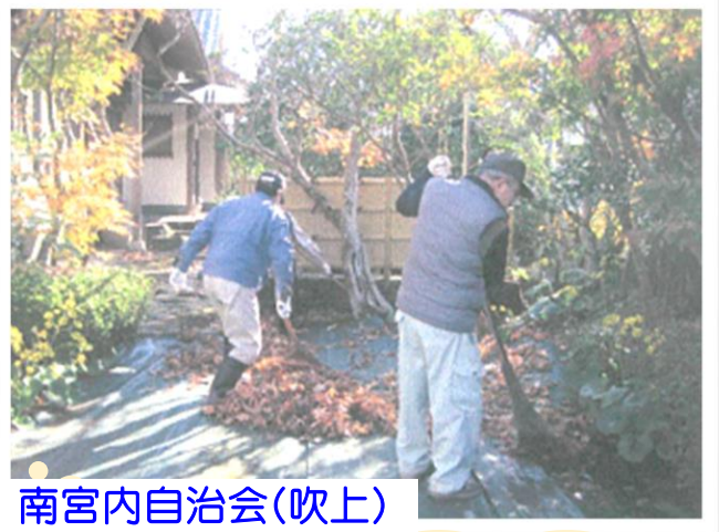
南宮内自治会(吹上)