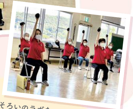
おそろいのラボちゃんポロシャツを着て 気持ちも明るく活動しています♪