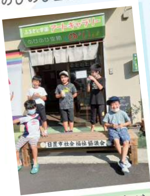
ベンチで一緒にかき氷を食べたよ

ラボちゃんポロシャツの 寄附金で 憩いの場にベンチ設置 みなさまのあたたかいお気持ちに感謝!