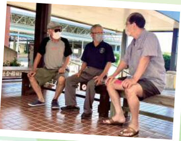
温泉のついでにベンチで 語って行こやー♪