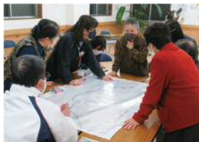
R3.吹上地域 支え合いマップづくり