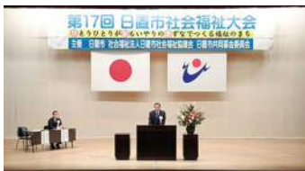
第17回日置市社会福祉大会