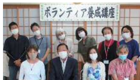
地域みんなが主役!! ボランティア養成講座(全5回)