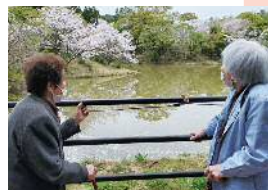
東市来デイサービス(観音ヶ池でお花見)