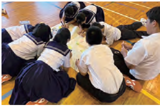
グループワーク・講話